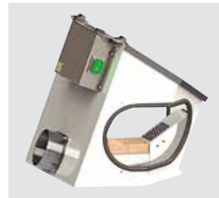
Absaug-Box Compact II