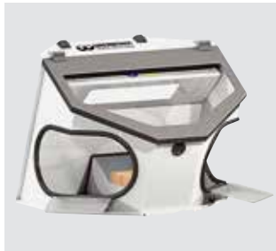
Absaug-Box Compact II mit Sonderzubehör Satz Armauflagen