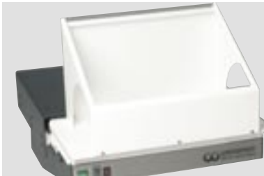
LSG-02 DE mit Universalsaughaube