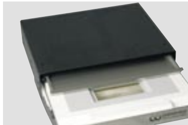
LSG-02 DE mit Zwischenschublade