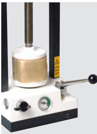
WW-33 1-3 Küvetten