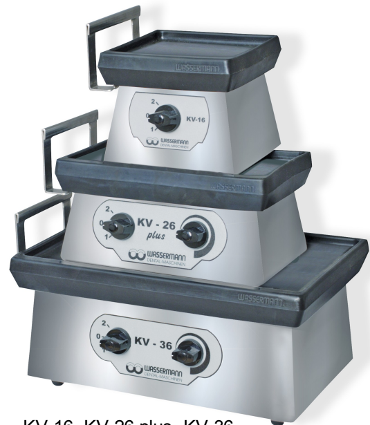
KV-16, KV-26 plus, KV-36 Edelstahlausführung Oberfläche matt