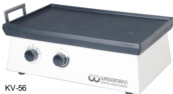
KV-56 Alu-Gussgehäuse kunststoffpulverbeschichtet (naturweiß ähnlich RAL 9016)