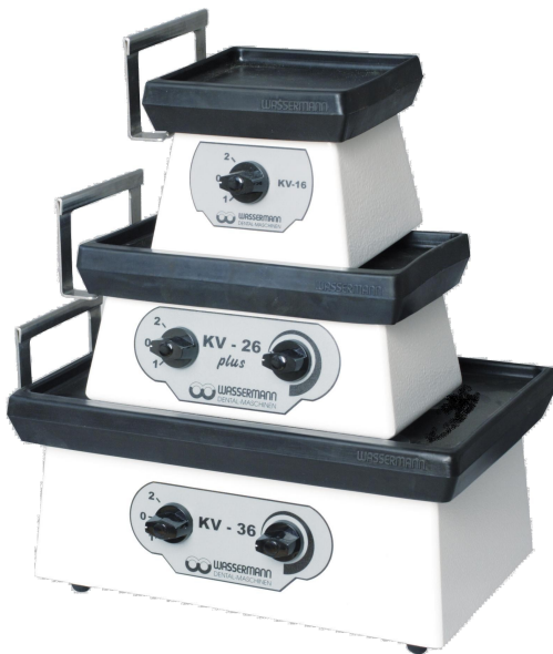
KV-16, KV-26 plus, KV-36 Edelstahlausführung kunststoffpulverbeschichtet (naturweiß ähnlich RAL 9016)