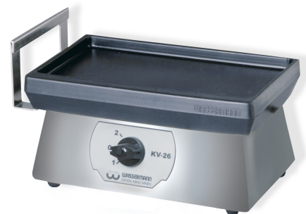
KV-26 Edelstahlausführung Oberfläche matt