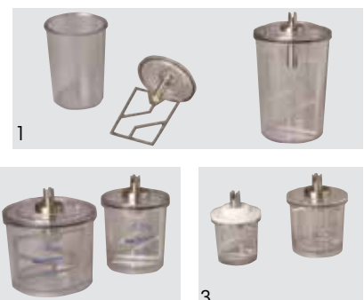
1. 1000 ml, 2. 600 + 350 ml, 3. 75 ml + 200 ml