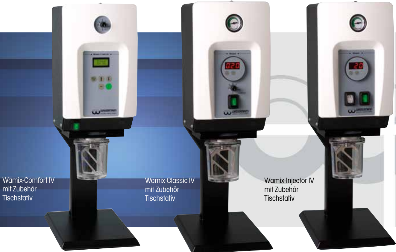
Wamix-Comfort IV mit Zubehör Tischstativ